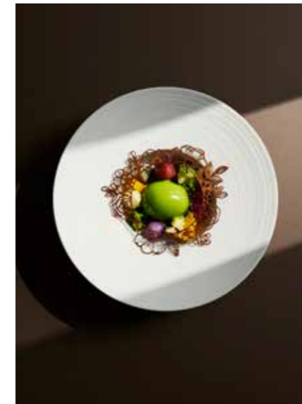
Œuf mollet, légumes d'hiver, émulsion épinard et truffe