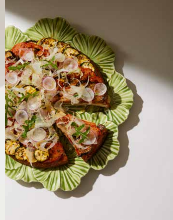
Tarte aux légumes d'été