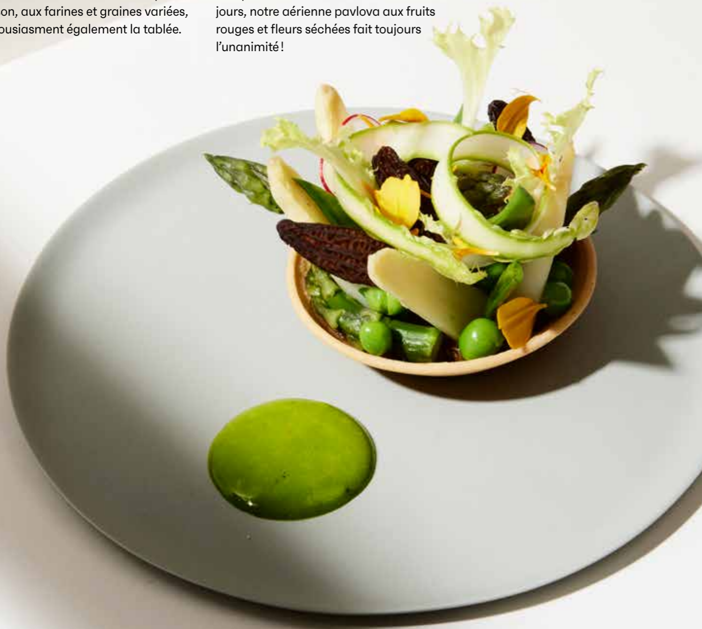
Tartelette morilles, asperges, petits pois et jus de cresson

Et comme nous nous appelons Potel & Chabot, nos chefs jouent du trompe-l'œil raffiné (la « cosse de petits pois », bouchée salée signature) ou réinventent le pithiviers... 100% végétal! Bio ou issus de la viticulture raisonnée, les vins sont en parfaite résonance avec nos propositions gourmandes, mais on peut accompagner le repas d'eaux détox, d'infusions bienfaitantes et de thés verts glacés. L'hiver, agrumes rares et grands crus de cacao entrent dans la composition des desserts et aux beaux jours, notre aérienne pavlova aux fruits rouges et fleurs séchées fait toujours l'unanimité!