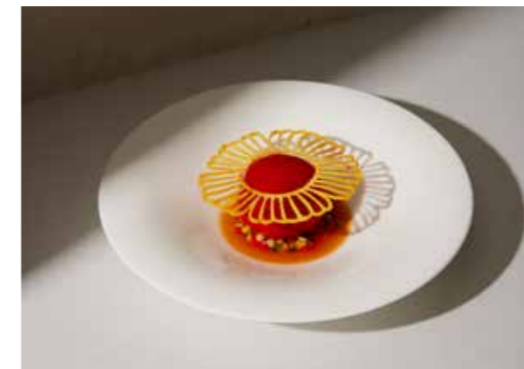
Tomate-burrata, brunoise de légumes et extraction de tomate