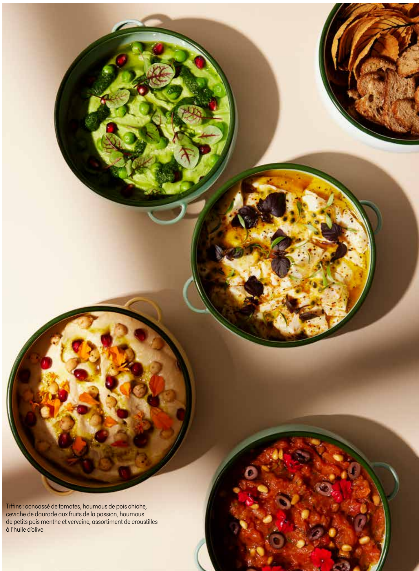
Tiffins : concassé de tomates, houmous de pois chiche, ceviche de daurade aux fruits de la passion, houmous de petits pois menthe et verveine, assortiment de croustilles à l'huile d'olive

— TRÈS CRÉATIF, NOTRE MENU COMBINE EN TOUTE LIBERTÉ PIÈCES À PICORER, « DIPS » MÉDITERRANÉENS REVISITÉS, pitas et pains d'ailleurs, grands plats métissés à partager et desserts de saison fruités. Tout se veut simple, accessible, mais avec, bien sûr, ces notes de surprise et cette pointe de sophistication qui sont la signature de la maison.