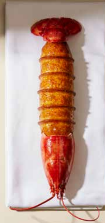
Koulibiac de homard