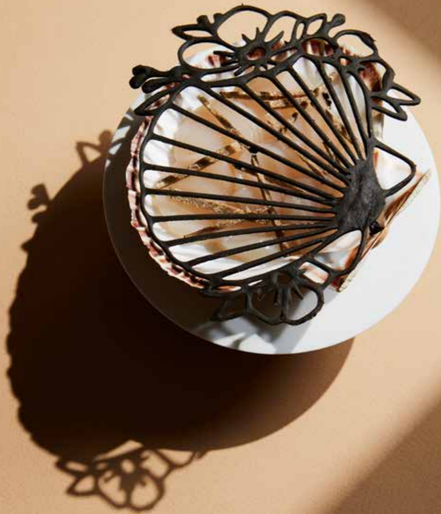
Saint-Jacques Art nouveau

— LE MENU MEMORIES CONVOQUE TOUT CE QUE NOUS SAVONS FAIRE DE MEILLEUR, AUJOURD'HUI COMME HIER: des petites bouchées raffinées; des entrées à surprises, tel l'ananas Victoria dans lequel se cache un mélange sucré- salé de mini-légumes de saison et d'agrumes; des plats qui allient la technique à l'inventivité, comme ce feuilleté de caille et son condiment graines de goji et baies d'épine-vinette. Des mariages inattendus, des ingrédients inédits renouvellent les classiques. S'inspirer du passé pour inventer des plats contemporains, voilà ce qui guide les créations de nos chefs. Ainsi, le traditionnel chou farci se réinvente en « chou de homard coraillé », encore plus festif et coloré. Mais nous pouvons aussi interpréter ce crustacé en très contemporain « lobster roll » et son cappuccino de cresson. Et comme notre menu Memories fait souvent référence au grand maître Escoffier, pourquoi ne pas terminer par sa célèbre poire Belle-Hélène, servie sur un socle de glace et coiffée d'une tuile de sésame?